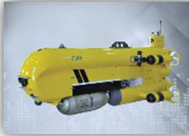
Systèmes Intelligents de Sûreté