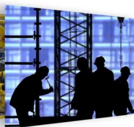
Systèmes Intelligents de Sûreté