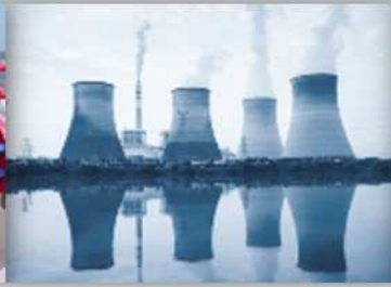
Protection en Milieux Nucléaires