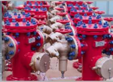
Projets et Services Industriels